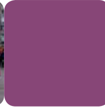
Musika Tresnak / Instrumentos