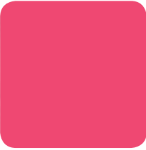
Abesbatza / Coro